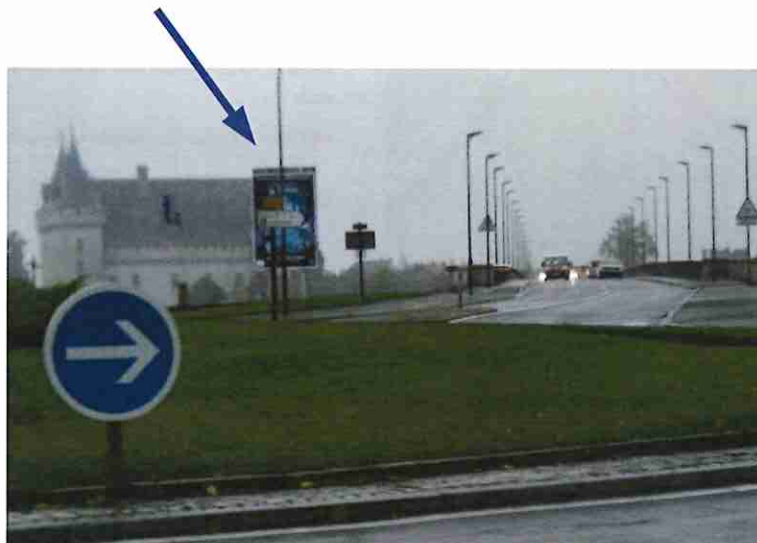
7 novembre 2016

http://www.valdeloire.org/uploadfiles/publications/135/Charte-publicite-exterieure-2006.pdf