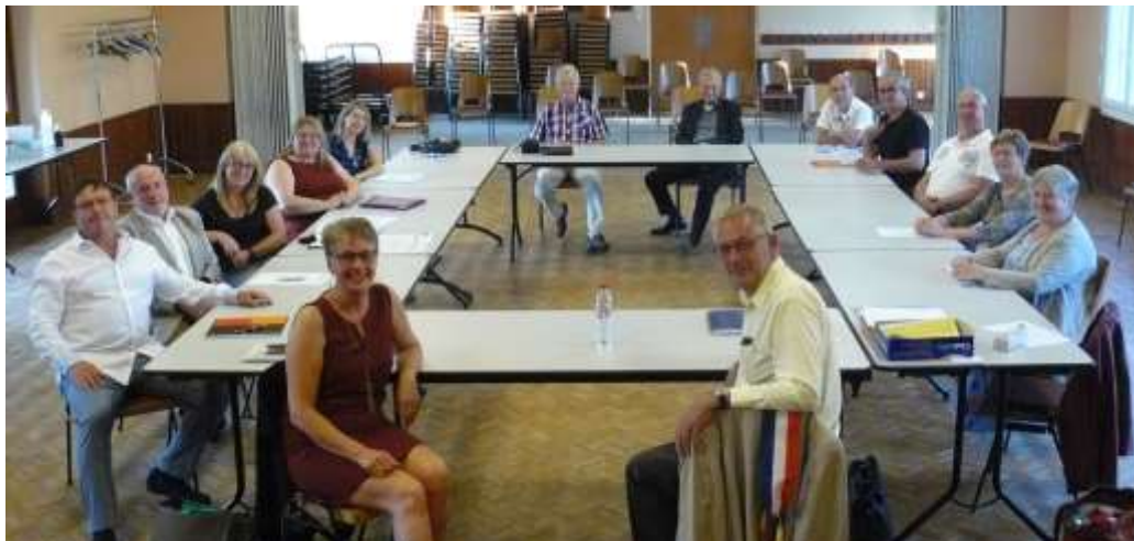
Mise en place du nouveau conseil municipal, le 28 mai.