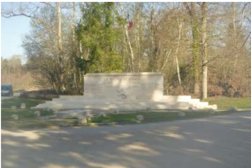
Randonnées USEP Cycle 3 - Maquis de Lorris