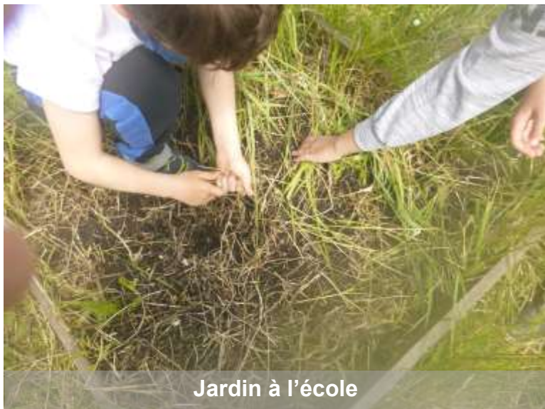
Jardin à l'école