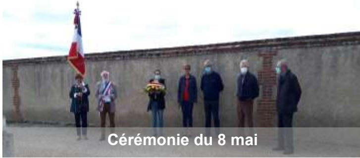
Cérémonie du 8 mai

Mise à part les cérémonies officielles, peu de manifestations ont eu lieu dans la commune pendant la période COVID.