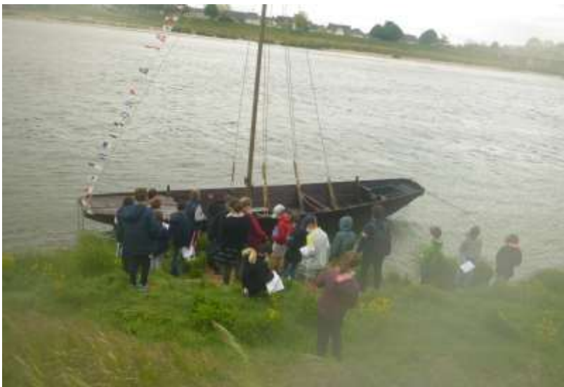
Nous surveillons Belle Aventure