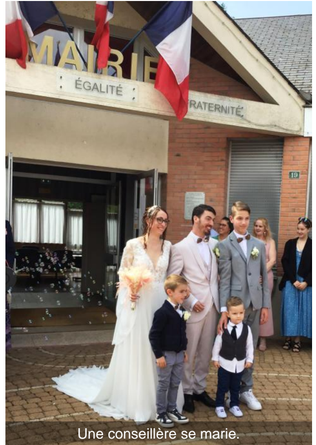
Une conseillère se marie.