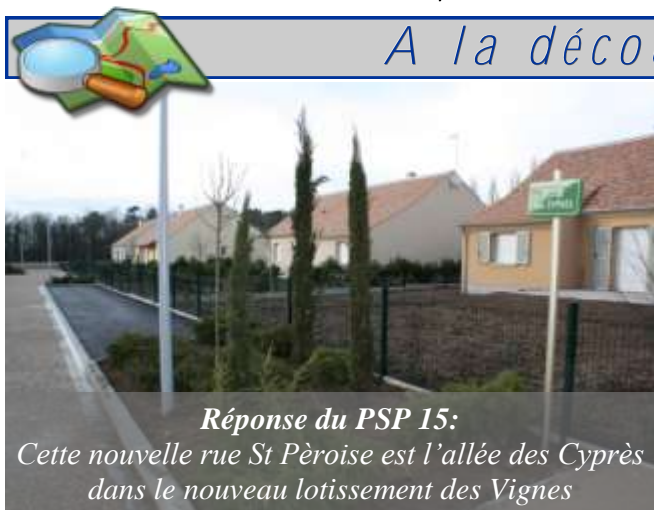
Réponse du PSP 15: Cette nouvelle rue St Pèreoise est l'allée des Cyprès dans le nouveau lotissement des Vignes

Amis randonneurs, où se situe cette borne ?