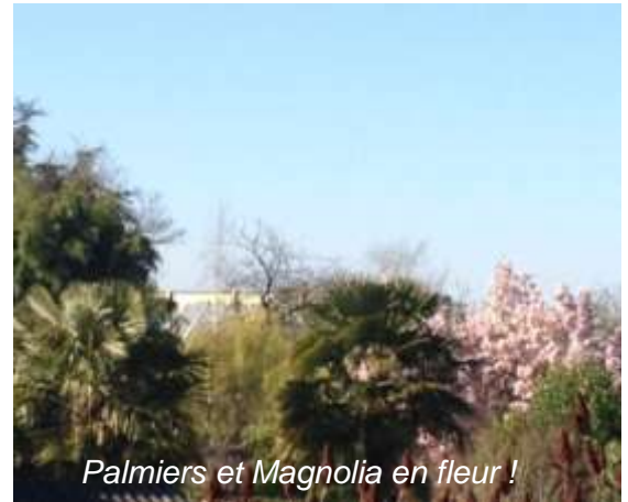
Palmiers et Magnolia en fleur !

Vous pouvez compter sur ma détermination et mon dévouement pour obtenir ces réponses.