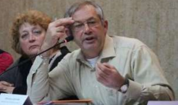
M. le Maire interpellant ses homologues en réunion de Communauté de Communes