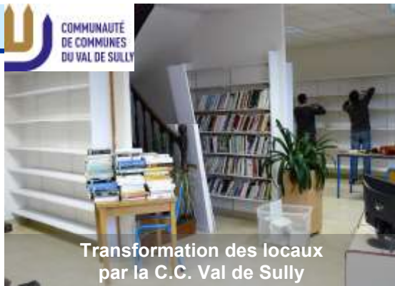
Transformation des locaux par la C.C. Val de Sully